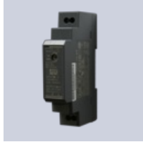
Transformator 24 VDC

Läs mer om produkten: https://www.ebeco.com/sv/produkter/tillbehor/markgivare