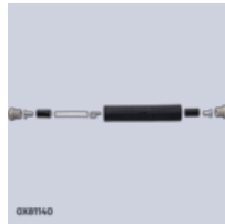
Skjøtesett Ex- Con