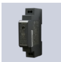
Transformator 24 VDC

Les mer om produktet: https://www.ebeco.com/no/produkter/snosmelting-mark/snowmat-0