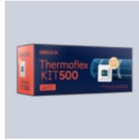
Thermoflex Kit 500