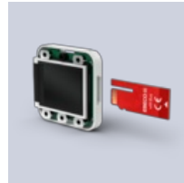
EB-Connect wM- Bus