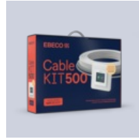
Cable Kit 500