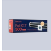
Foil Kit 500