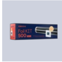
Foil Kit 500