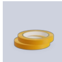
Lämpökaapelin kiinnitysteippi, 2-pakkaus

Lisätietoja tästä tuotteesta: https://www.ebeco.com/fi/tuotteet/lattialammitys/cable-kit-500