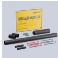
Kytentä- /loppupäätepakkaus F-10/T-18/T-18 CT kytentään

Lisätietoja tästä tuotteesta: https://www.ebeco.com/fi/tuotteet/putkien-jaatymissuojaus/f-10