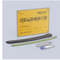
F-10 Silikon liittä- mä-päätössarja