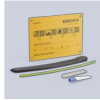
F-10 Silikon liittä- mä-päätössarja