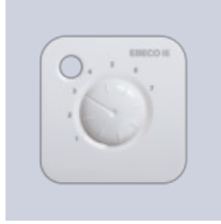
Dækfront EB- Therm 55

Lisätietoja tästä tuotteesta: https://www.ebeco.com/fi/tuotteet/ohjaus/eb-therm-55