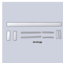
Liitossarja ELVB- SRV-H

Lisätietoja tästä tuotteesta: https://www.ebeco.com/fi/tuotteet/teollisuus/elsr-sh-0