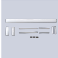
Liitossarja ELVB- SRV-H