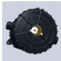
Kytkentärasia ELAK EX-R