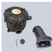
Samledåse EX- it-R