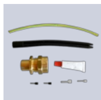
Anslutningssats ELVB-SREx- SH+-20