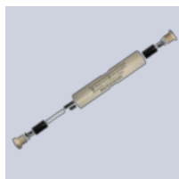
Samlingssæt ExCON SR