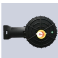
Samledåse EX- it-R