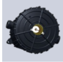
Abzweigdose ELAK EX-R