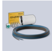
Connection Kit Foil