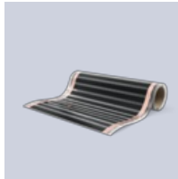
Foil 230 V