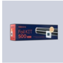
Foil Kit 500