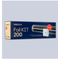
Foil Kit 200