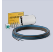
Connection Kit Foil