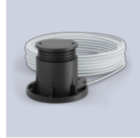
Feuchtigkeits- und Temperatursensor

Hier können Sie mehr über das Produkt Lesen: