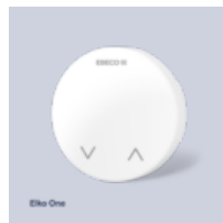
Frontverkleidung EB-Therm 300